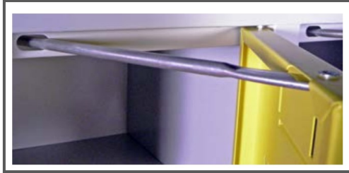
Türöffnungsbegrenzer (Seite 3)